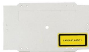
2D000002 Deckel für Spleißkassette

Deckel für Spleißkassette, reinweiß. Mit Aufkleber: Laser KLASSE 1