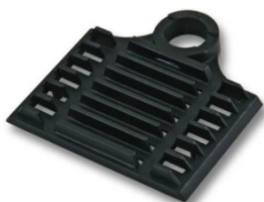
2H000002 Spleißhalter für Schrumpfspleißschutz

Spleißhalter für 6 x Schrumpfspleißschutz, schwarz.