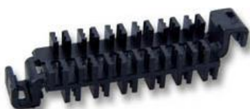
2Z000002 Zugentlastung für Aderpigtails

Zugentlastung für 0,9mm Aderpigtails zur Montage in die Spleißkassette, schwarz.