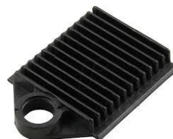
2H000002 Spleißhalter für Krimpspleißschutz

Spleißhalter für 12 x Krimpspleißschutz, schwarz.