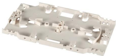
2S000002 Spleißkassette stapelbar, reinweiß

Spleißkassette für die Aufnahme von 2 Spleißhalter, stapelbar, reinweiß