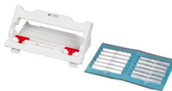
2KSP53100.5 Kunststoff Spleißschutzpresse inkl. 12 Crimpspleißschutz

Kunststoff Spleißschutzpresse inkl. 12 Stück Crimpspleißschutz