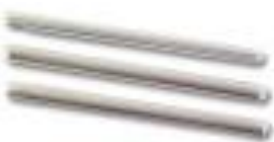
2SS000602 Schrumpfspleißschutz 60mm lang 2SS000402 Schrumpfspleißschutz 40mm lang

Kunststoff Spleißschutzpresse inkl. 12 Stück Crimpspleißschutz